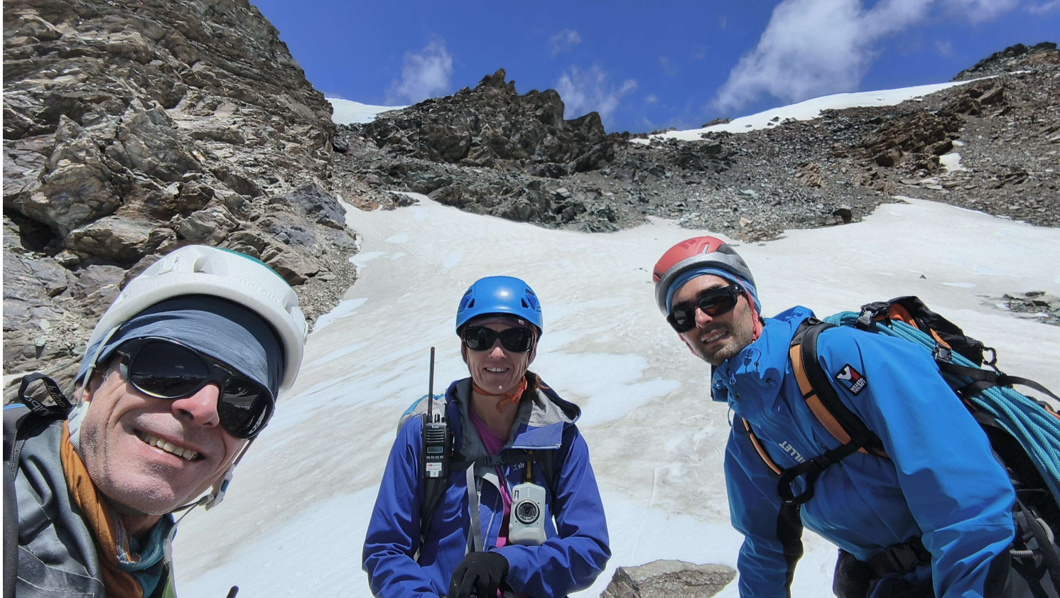
Montée et descente de la grande Aiguille Rousse