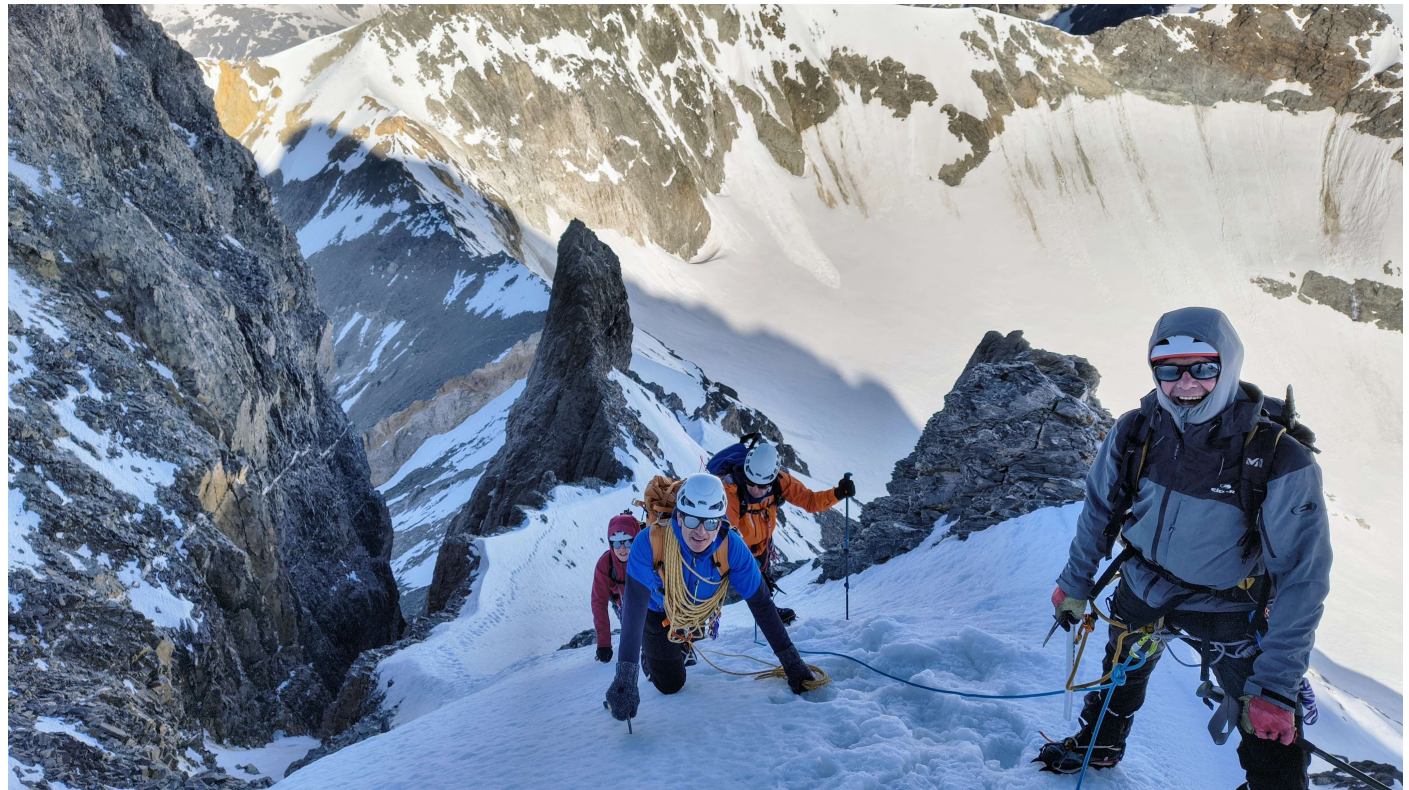
Arête ouest de la Dent Parrachée