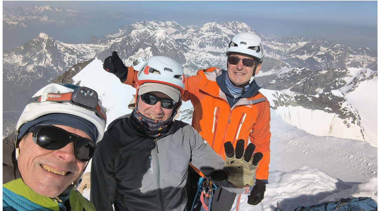
Sommet et descente de la Dent Parrachée