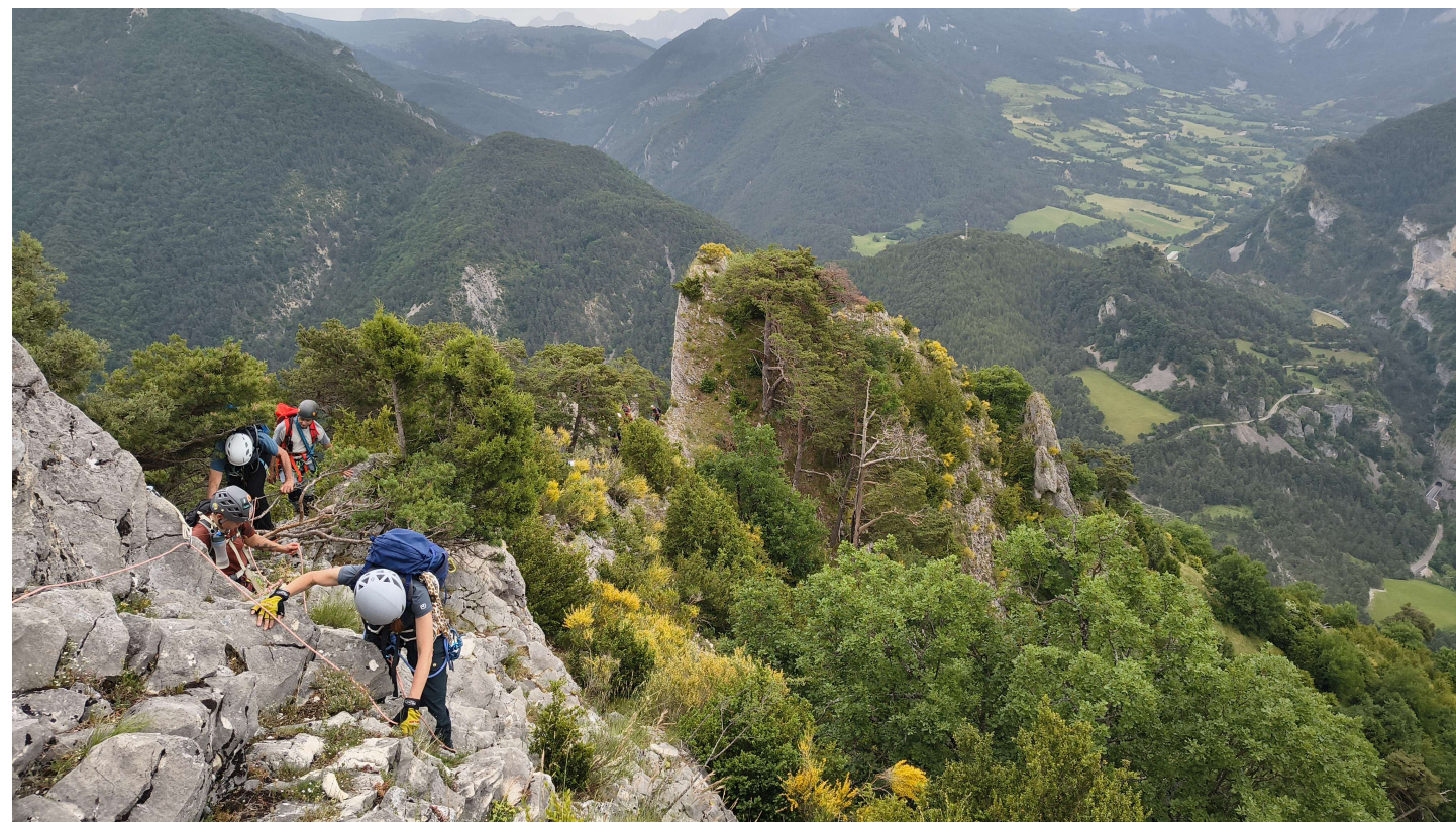
Arête et traversée du pic de l'Aigle dominant Reychas Via ferrata de Luc en Diois